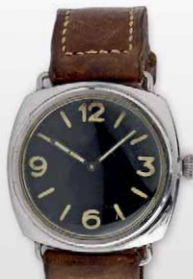
Panerai 成交總價 90,250 歐元