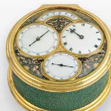
Barraud 成交總價 273,000 歐元