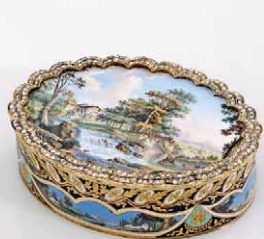
Louis Galopin 成交總價 46,000 歐元