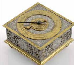
Ulrich Schniepp 成交總價 39,700 歐元