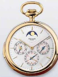
Patek Philippe 成交總價 89,300 歐元