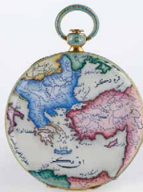
Chenevard 成交總價 96,800 歐元