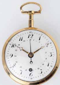
Seyffert 成交總價 111,600 歐元