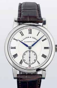
Lange & Söhne 成交總價 130,200 歐元