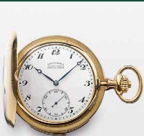
Ulysse Nardin 成交總價 86,400 歐元