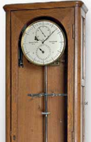
Riefler 成交總價 43,400 歐元