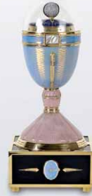
Fabergé 成交總價 248,000 歐元